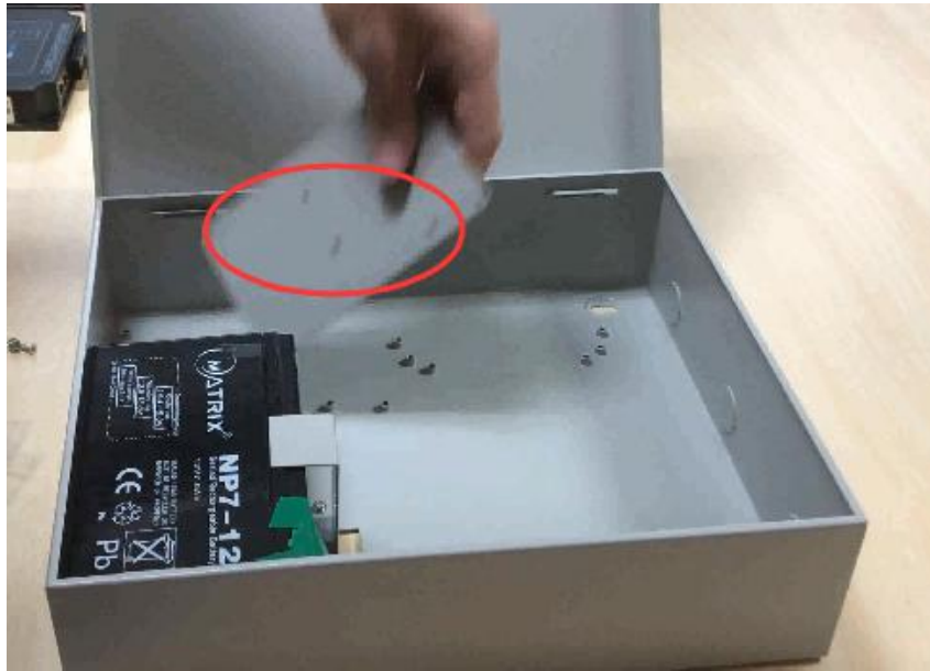
b. 把电源固定在底板上；