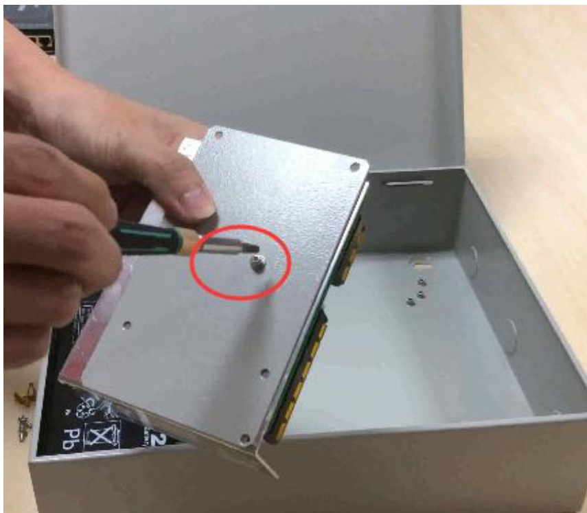
c. 把固定了电源的底板装回铁箱；